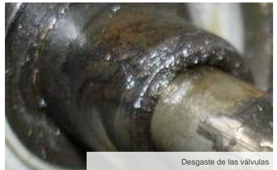
Desgaste de las válvulas