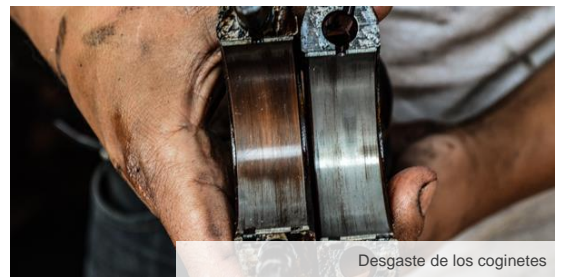
Desgaste de los coginetes