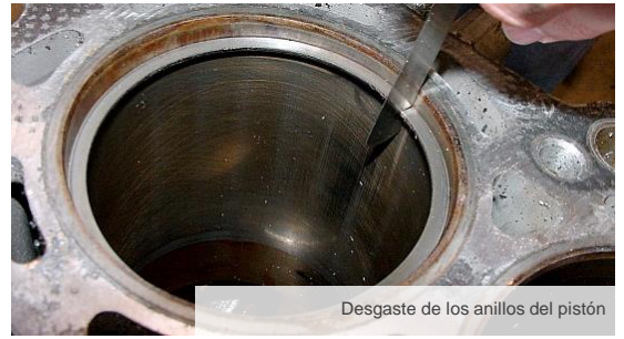
Desgaste de los anillos del pistón