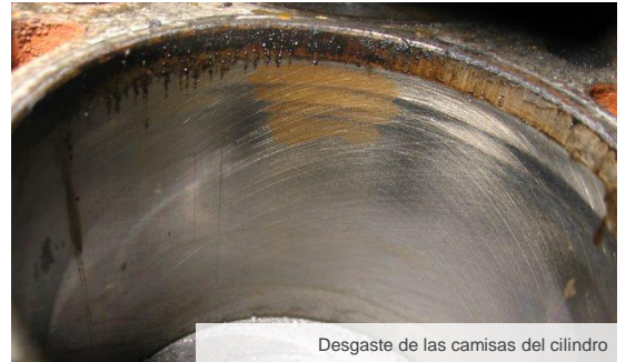
Desgaste de las camisas del cilindro