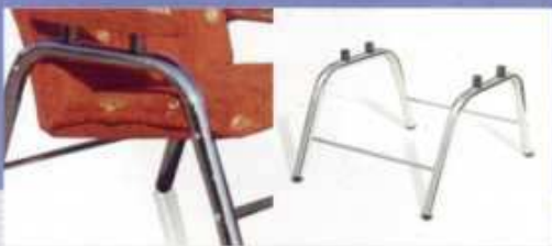
fotel chrom tuleja