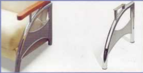
wersalka i fotel chrom siatka spawana