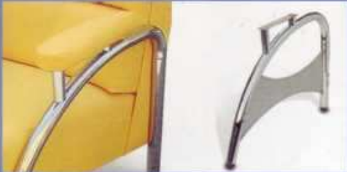
wersalka i fotel chrom siatka glęta