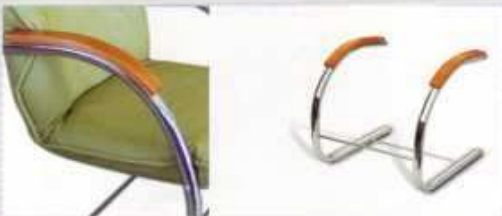
fotel chrom owal