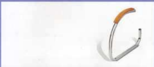
wersalka chrom owal