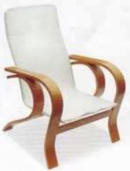
stelaż Marta II