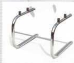
fotel chrom prosty