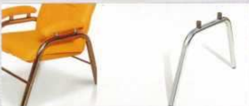
wersalka chrom tuleja