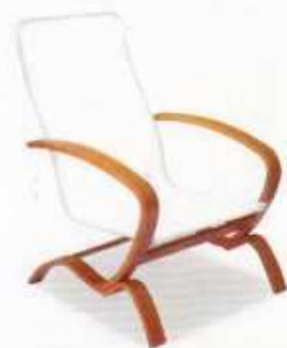
stelaż Krzyżak 8