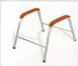
fotel chrom drewno